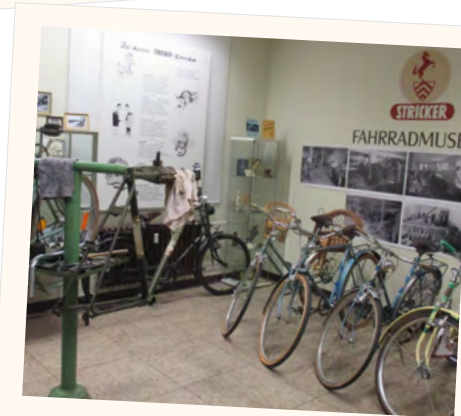
Stricker-Fahrradmuseum, eröffnet 2017

Das Amtszimmer, das Kartenzimmer, Rolf Künnemeyer-Stube, Brackweder Gaststätten, Archivzimmer und einiges mehr.