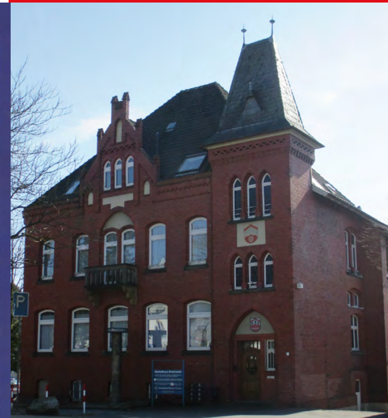
Das Heimatmuseum im „Roten Amt“