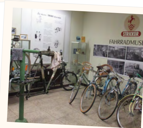
Stricker-Fahrradmuseum, eröffnet 2017

Das Amtszimmer, das Kartenzimmer, Rolf Künnemeyer-Stube, Brackweder Gaststätten, Archivzimmer und einiges mehr.